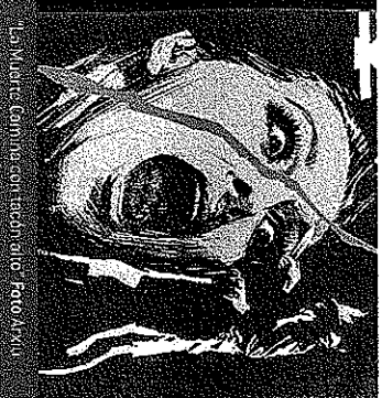
La Morte Coma en escultura

► Un altre sala que també pretén animar l'oferta de música en directe durant aquest 2010 és LOUSE SE VA. La coneguda sala del barri d'Horta acaba de anunciar el següent: "En breu a la sala Louise Se Va tots els divendres a mitja nit tornarem a sentir música en directe. En aquest temps que corren la sala Louise Se Va és conscient de les dificultats que tenen els músics per trobar llocs on poder mostrar les seves creacions, per tant vol facilitar el màxim per que aquests tinguin un lloc on fer-ho". Més info a http://louise.seva.com/ .