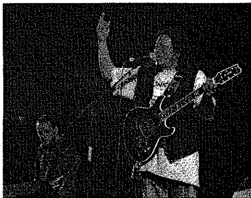
Un concierto de Raimundo Amador en Ripollet